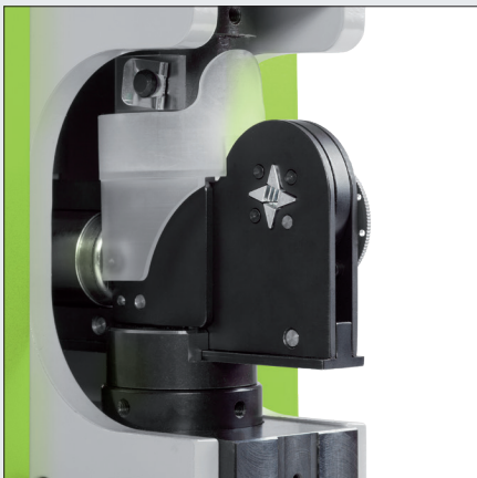
profilierte, selbsteinstellende Crimpflächen