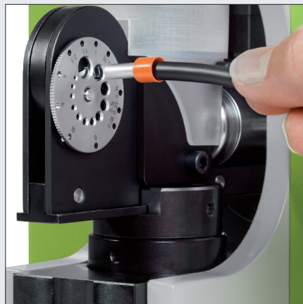
verstellbare Einführhilfe und Tiefenanschlag