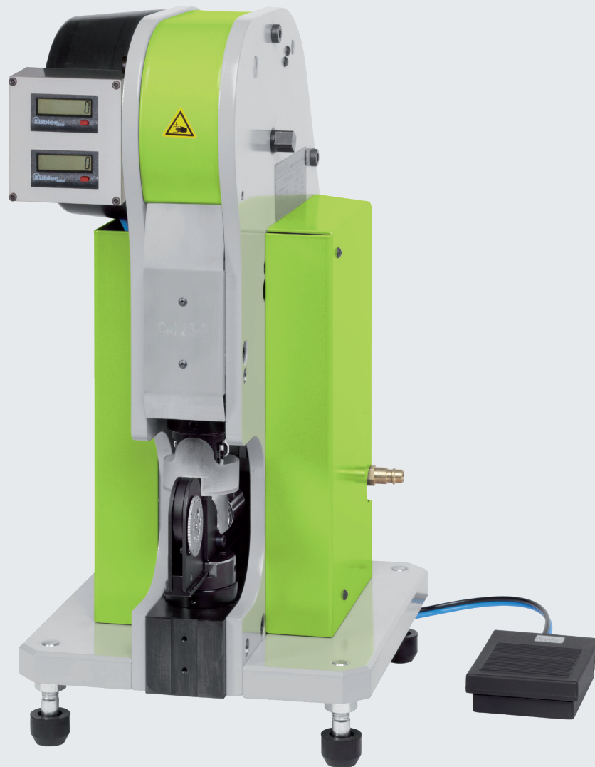
Modell CM 25-3 mit Einsatz für Aderendhülsen